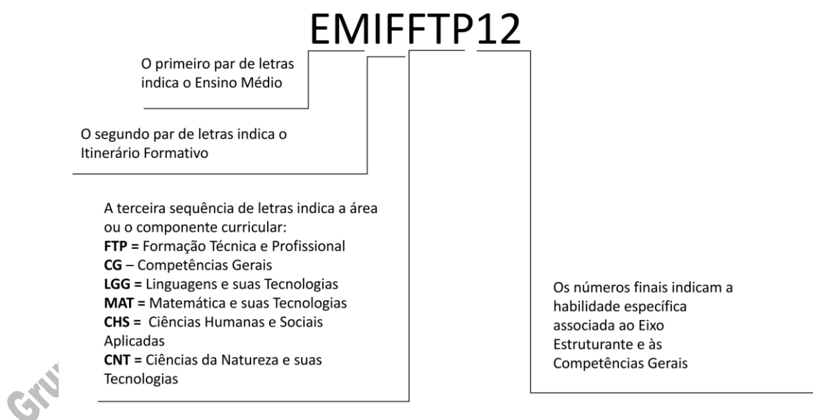
Gráfico explicativo do Código de Habilidade da Formação Técnica Profissional – FTP

A distribuição das habilidades indicadas acima ocorre em conformidade com a correlação entre estas habilidades e as atribuições empreendedoras, apresentada nos Componentes Curriculares em que as atribuições correlatas forem alocadas, cumprindo, dessa forma, a função prevista pelos Eixos Estruturantes.